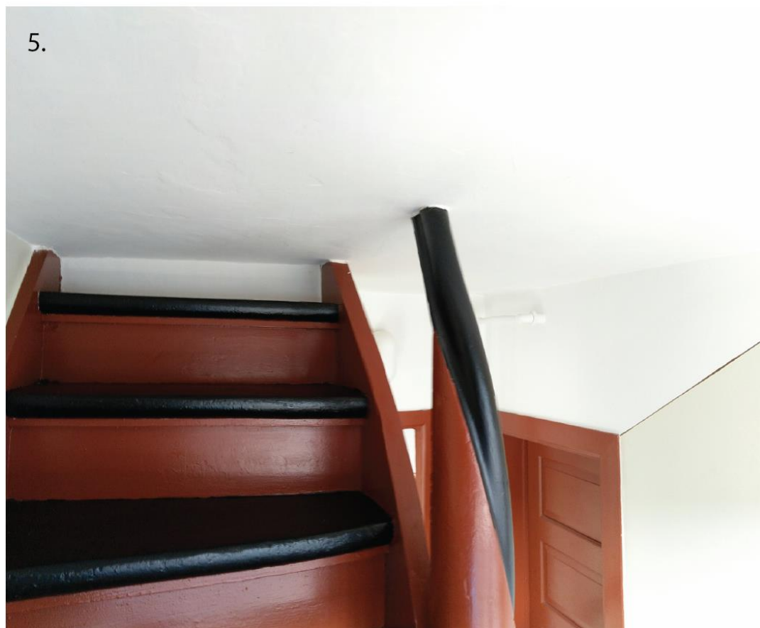
Billede 4 og 5: Nummereret i den rækkefølge man går op ad trappen (fortsat).